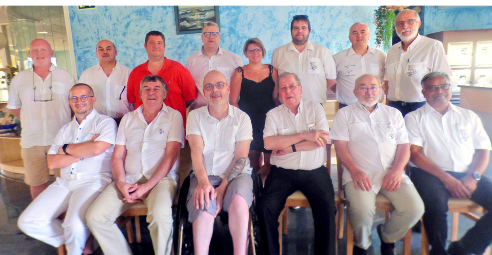
Le Conseil d'Administration de la FFT pour la saison 2023-2024 :